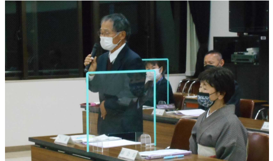
黒木会長と前田副会長