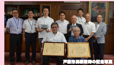
戸部市長顕彰時の記念写真