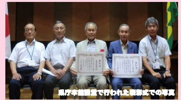
県庁本館議室で行われた表彰式での写真