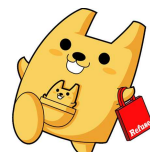
マイバッグ利用推進イメージキャラクター「エコガール」