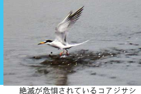
絶滅が危惧されているコアシサン