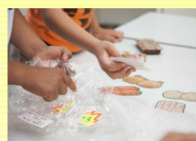
「買い物ゲーム」の様子