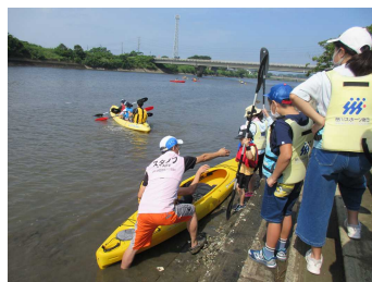
広瀬小学校区地域づくり協議会 カヌー教室