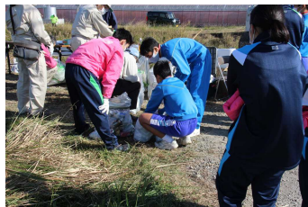
大宮地域まちづくり協議会 新別府川クリーンアップ