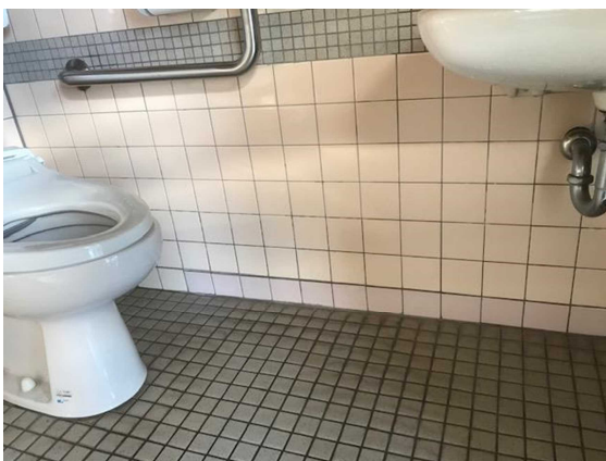
トイレ補修後写真