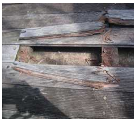
中庭床板木材劣化②