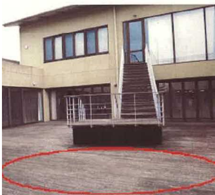
中庭床板木材劣化①