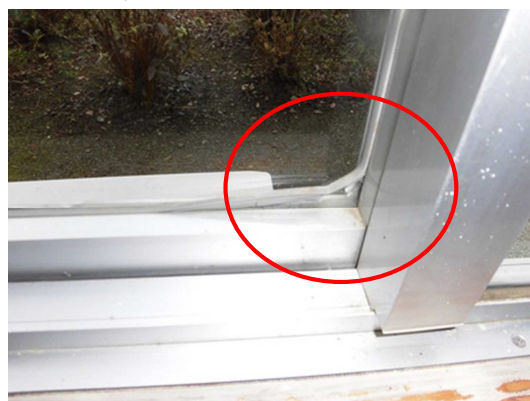
ガラス押えの剥がれ