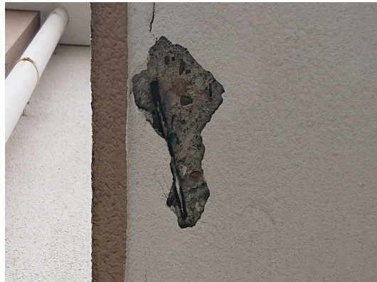
コンクリート欠損、鉄筋腐食