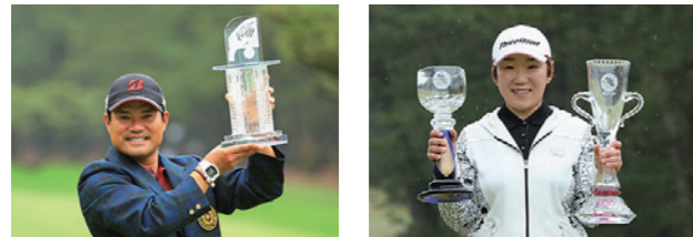
①前回大会優勝 宮里 優作 選手 ②前回大会優勝 申ジエ 選手

①ダンロップフェニックストーナメント(11月17日～20日) や②LPGAツアーチャンピオンシップリコーカップ(11月24日～27日)に合わせて、各地でイベントを開催します。