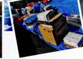
令和3年度 追加資機材の補充