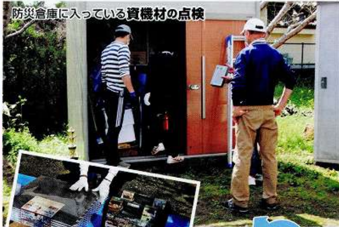
防災倉庫に入っている資機材の点検