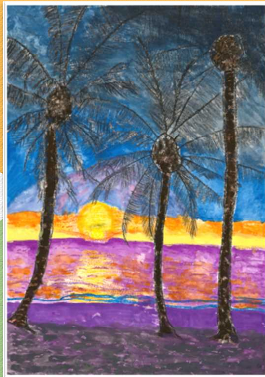
第12回 小学5・6年生の部 金賞『夜明け』