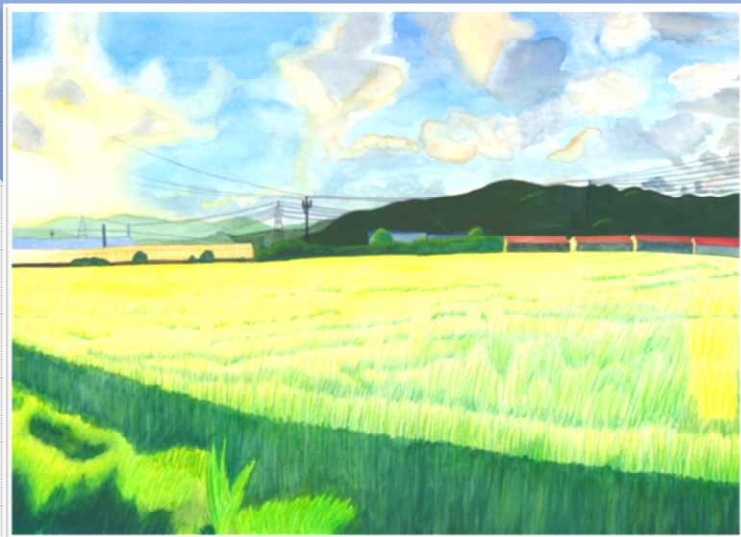
第12回 中学生の部 金賞『夕日と共に輝く田んぼ』

将来を担う子どもたちに、宮崎市のまちなみ・風景を描いてもらうことにより、まちなみ・景観への関心を高め、意識の向上を図ります。