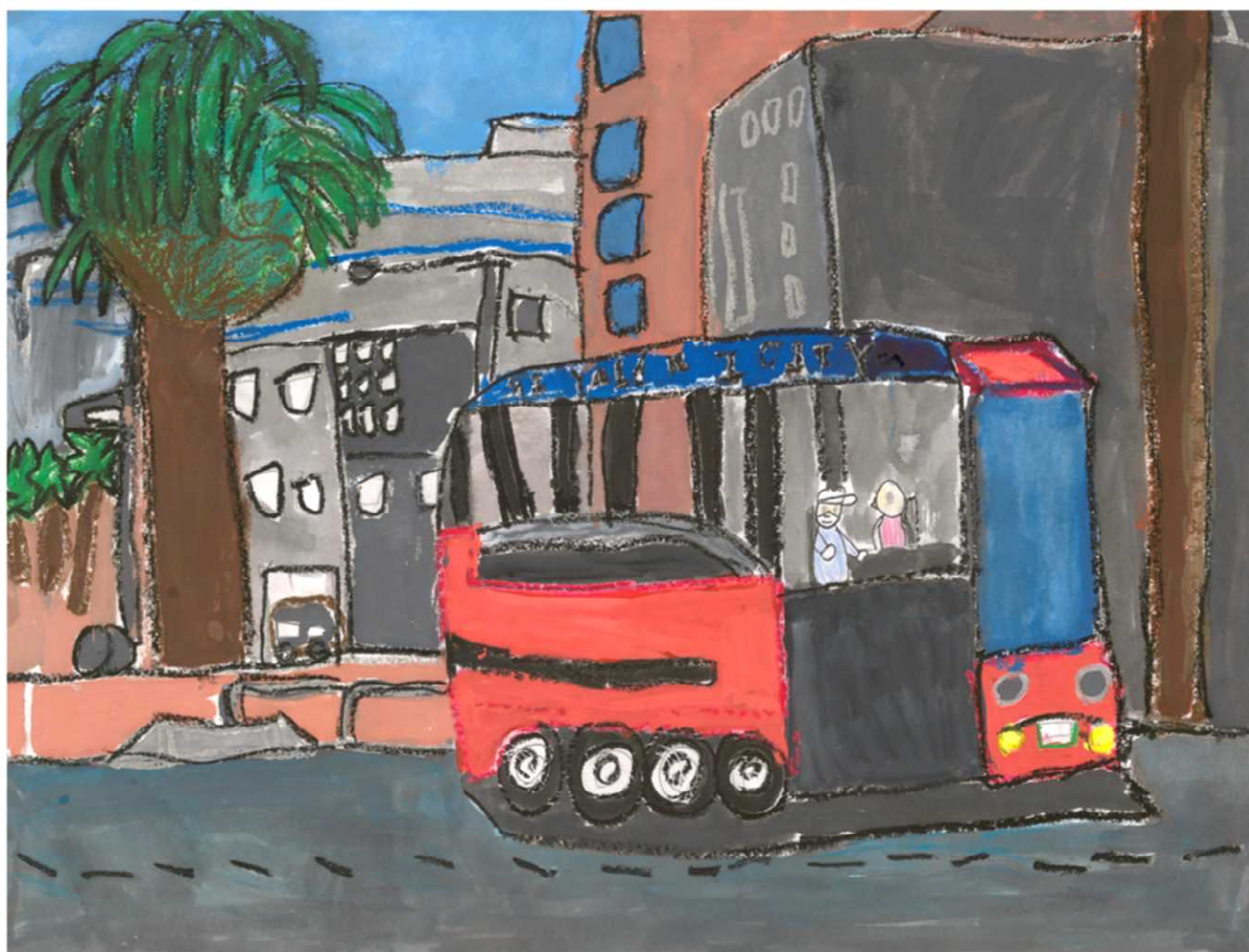
第12回 宮崎市風景絵画コンクール 小学1・2年生の部 金賞 『がんばれ ぐるっぴー』