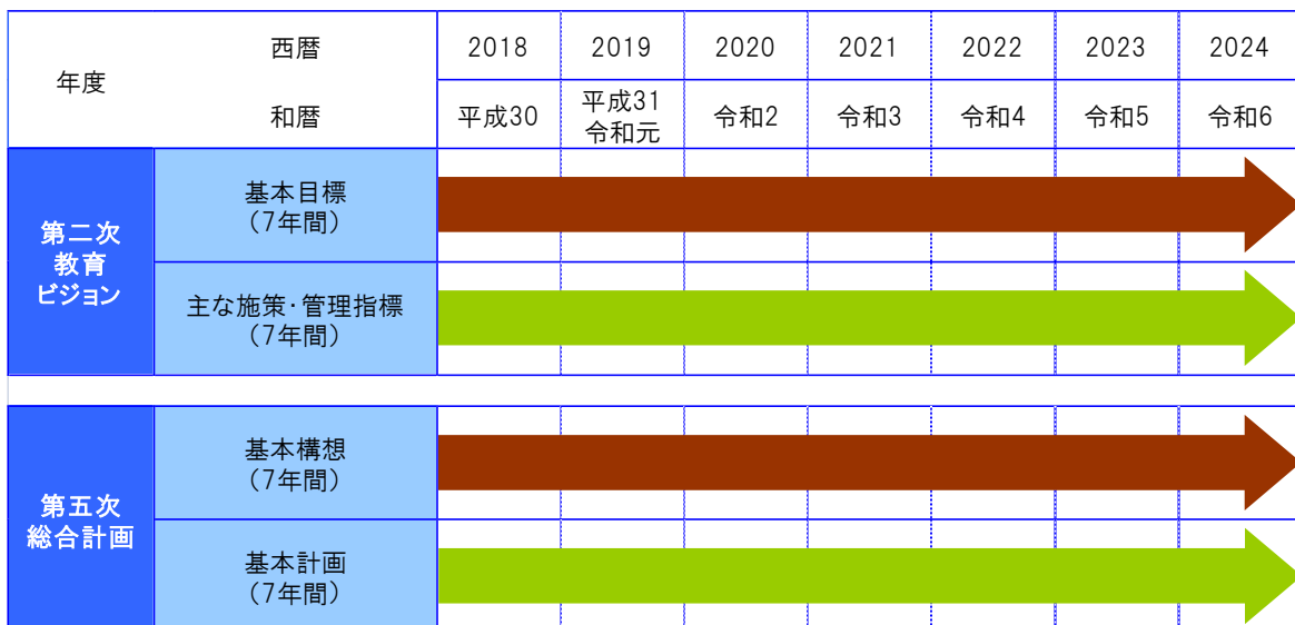
図表3 計画期間と見直しのイメージ

第二次宮崎市教育ビジョンの計画期間は、平成30年度（2018年度）から令和6年度（2024年度）の7年間とします。