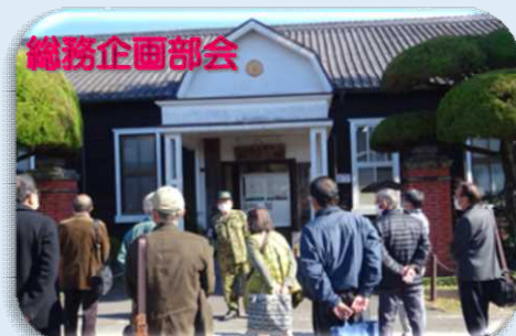
まちづくり研修事業

○あなたもまちづくりに参加しませんか○ まちづくり委員会を通じて、気の合う仲間や友達の輪を 広げることができます。ぜひご参加ください。