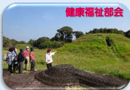
シニア日帰りバス旅行