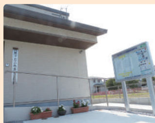
月見ヶ丘ふれあい公民館

掲示板には赤江まちづくりの広報誌や各自治会の情報がたくさん掲示されています。お近くに掲示板がある方は、皆さんご覧ください!!