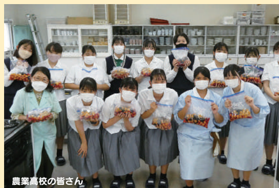
農業高校の皆さん

* 設営した防災かまどベンチを実際 にを使って炊き出しを行います。 (協力)宮崎県立宮崎農業高校