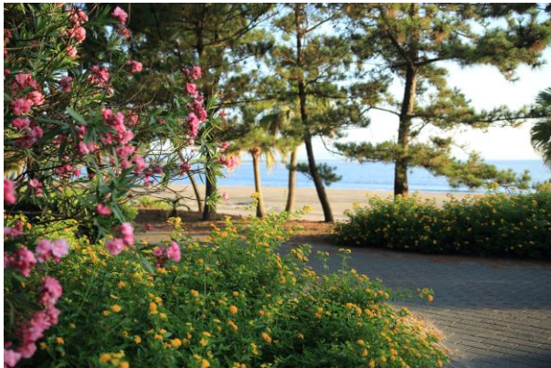
作品タイトル：カラフル散歩道