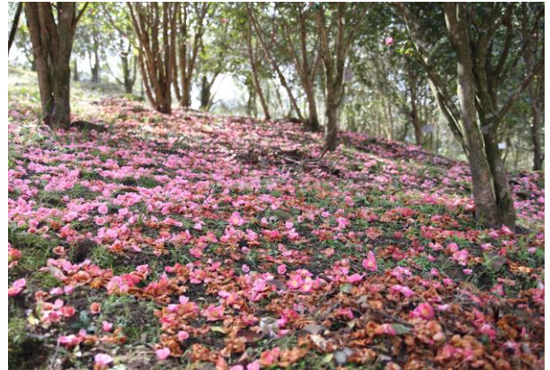
作品タイトル：椿の絨毯