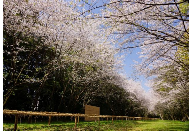
作品タイトル：流鏝馬馬場の桜