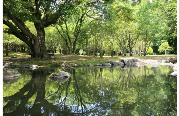
作品タイトル：ふたつの森