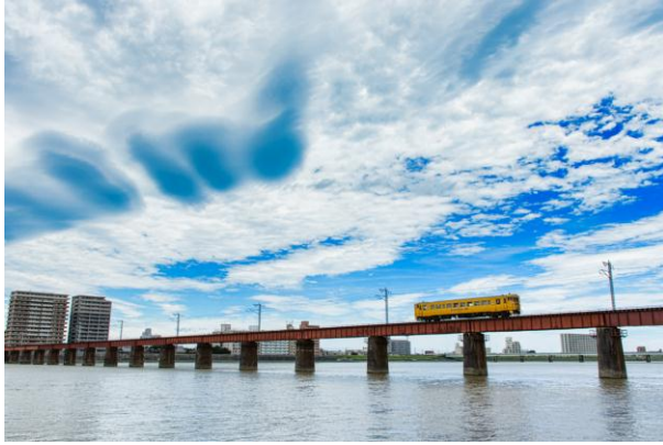
作品タイトル：大動脈