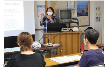
【災害時に備え、私達に出来る事は・・・】の一場面

さて、13の講座の様子につきましては、今後、館報「たちばな」に掲載していきます。楽しみにしてください。