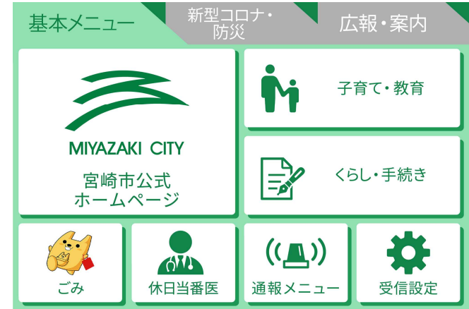
拡張後（最大12メニュー×3タブ）