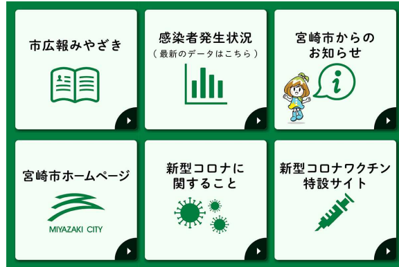
これまで（最大6メニュー）