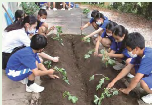
大宮中：にんじん芋の苗植え

また、大宮地域まちづくり推進委員会より、令和4年度「地域まちづくり推進委員会事業」事業実績報告及び事業見通しについて、中間報告があり、大宮小のあいさつ運動を支援するための旗を作成したことなどが報告されました。