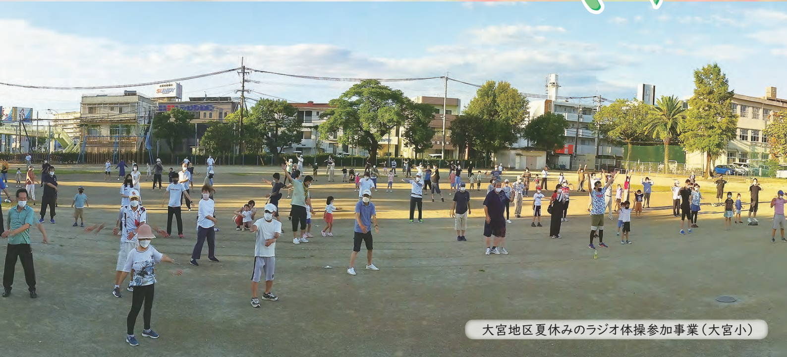
大宮地区夏休みのラジオ体操参加事業(大宮小)