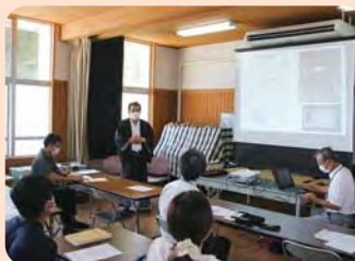
学校と地域のリーダー育成事業