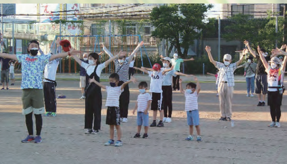
夏休みのラジオ体操(大宮小)