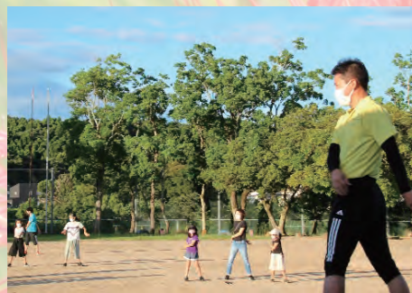
夏休みのラジオ体操(池内小)