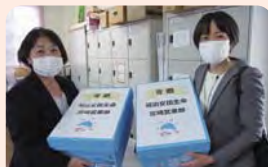
明治安田生命宮崎営業部の皆様から

届いた品物は、お米、乾物、調味料、缶詰、レトルト食品、菓子類など多品目にわたりました。子ども食堂「えがお」をはじめ、子どもたちとの交流活動に活用していただきます。