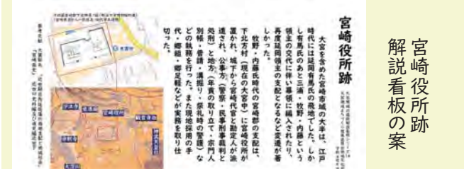
宮崎役所跡 解説看板の案