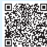
まちづくりHPのQRコード

大宮地域まちづくりでは推進委員を募集しています。どなたでも参加できます！ 地域まちづくり活動はホームページをご覧ください。