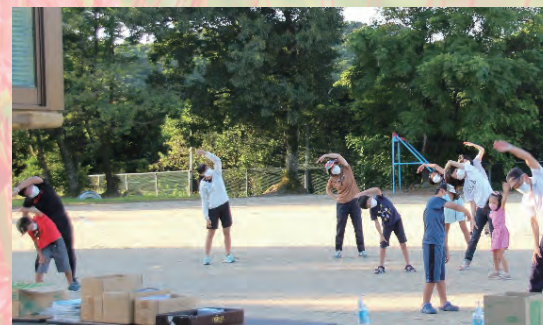
夏休みのラジオ体操(池内小)