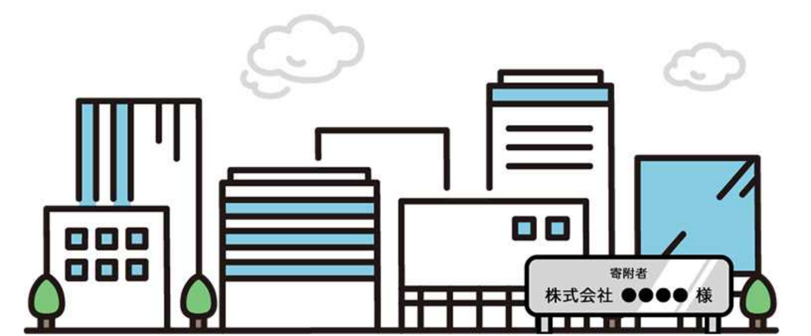
ネームプレートの設置 (ハード事業)