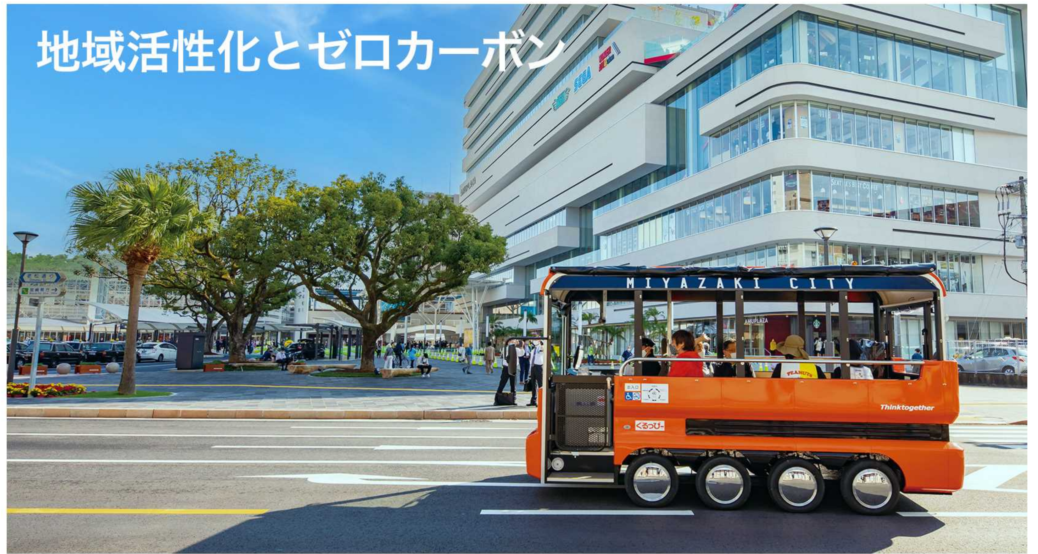
地域活性化とゼロカーボン