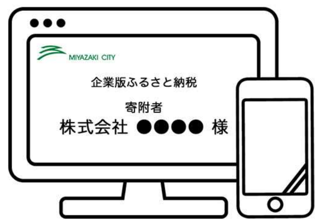
市HP等で寄附のご紹介