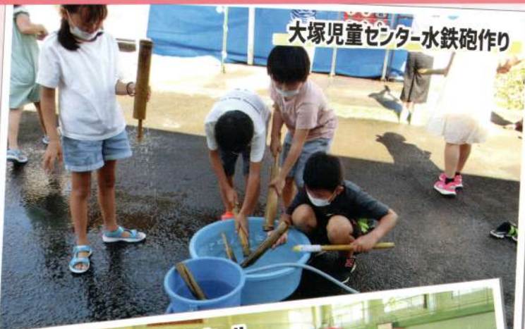
大塚児童センター-水鉄砲作り