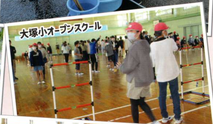
大塚小オープンスクール