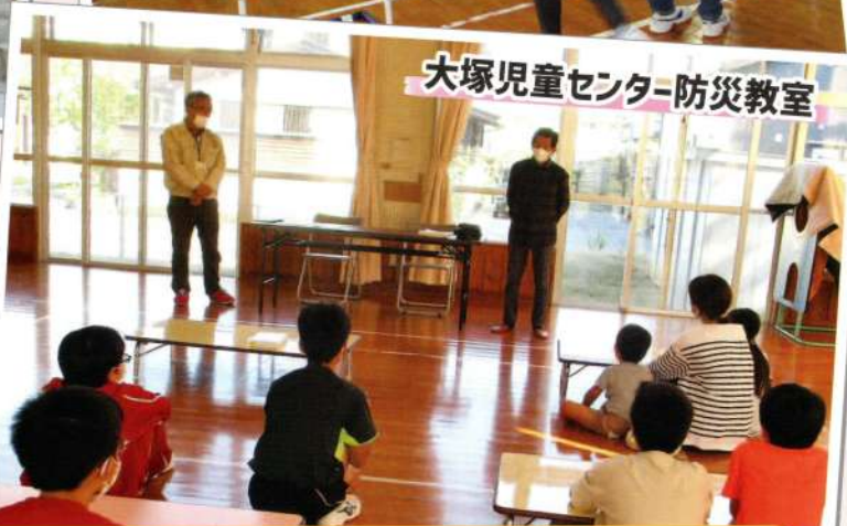
大塚児童センター-防災教室