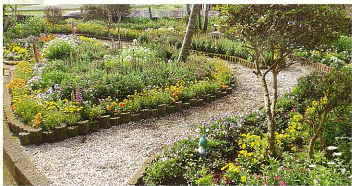
最優秀賞 長嶺ボランティア