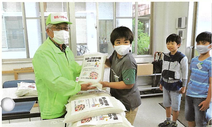
生目小学校5年生からお米の贈呈を受けました。

令和3年度は、216名の方が見守り隊員として登録されています。 子どもたちの安全は地域の力が大事です。見守り隊の日頃の活動に感謝です。