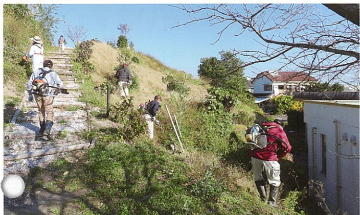
石塚城址公園の除草作業を行いました。