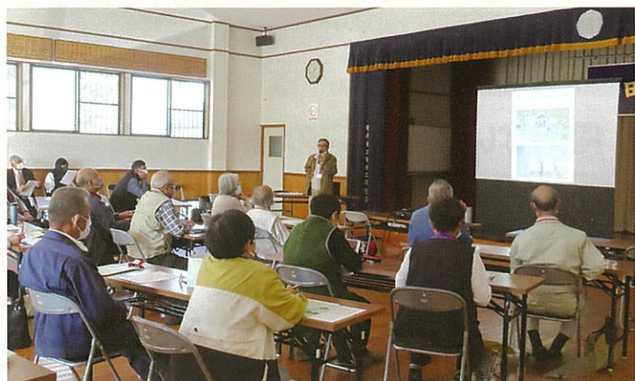
トコロジスト養成講座(浮田公民館)