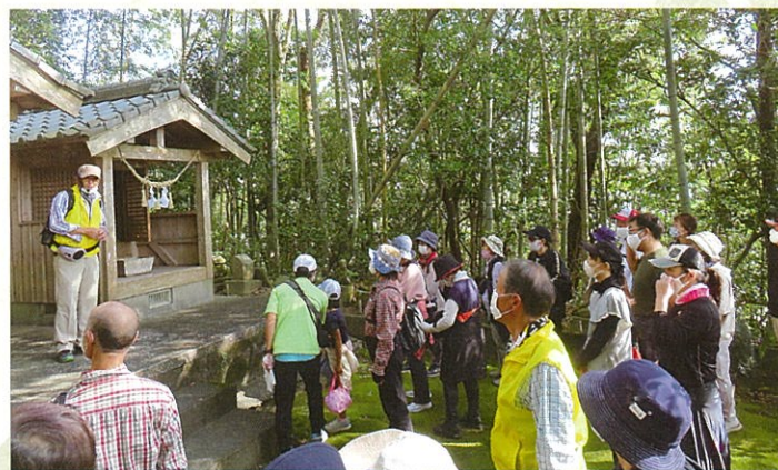
秋の史跡巡りウォーキング(大將軍神社)

※総務部会と健康福祉部会は、新型コロナウイルス感染症対策のため、令和2年度の事業が取り組めませんでした。