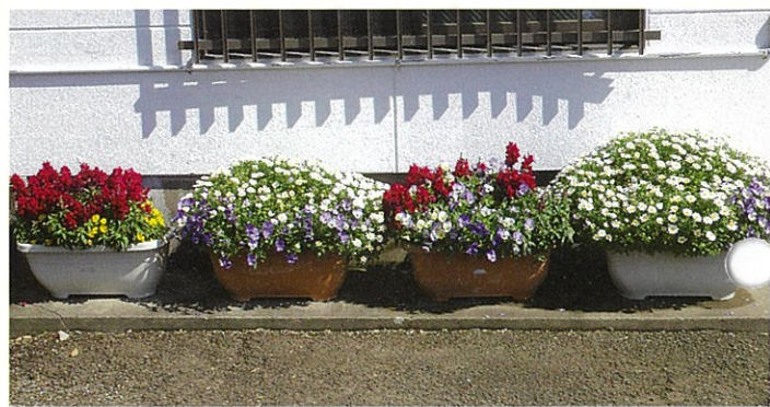
優秀賞 下小松自治会