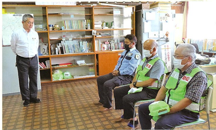
生目中学校での見守り隊感謝集会