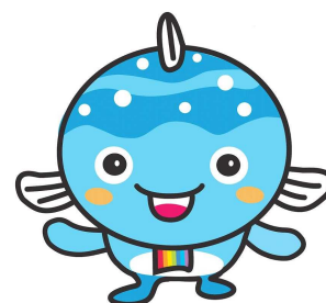
宮崎市河川浄化イメージキャラクター カワット