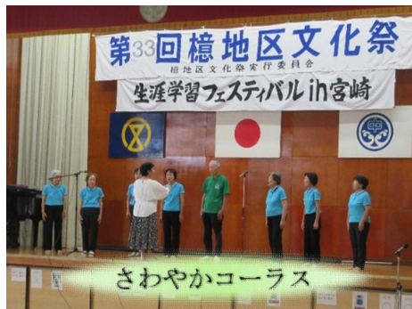
さわやかコーラス