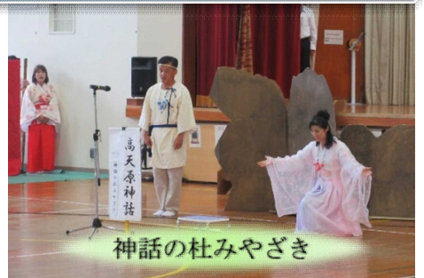
神話の杜みやざき