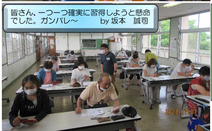
まずはSDGsをみんなで考えて・・・檜の農業・産業へのつながりを学びました。 by 檜人