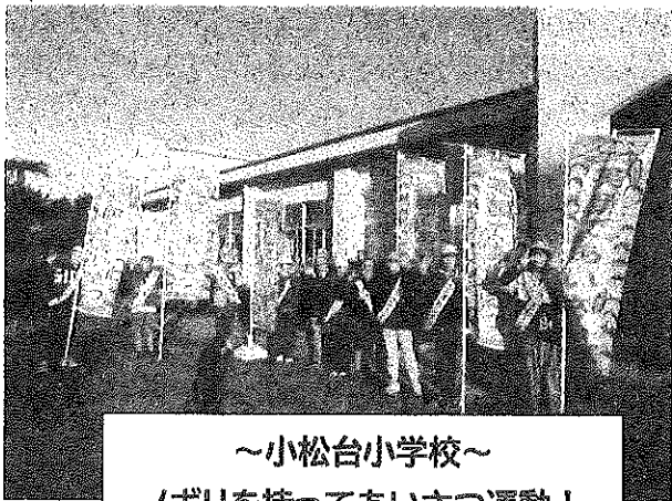
～小松台小学校～ ノボリを持ってあいさつ運動！

生目小学校では、腕章をつけた子どもたち、小松台小学校では黄色い反射バンドを腕に巻いている子どもたちがあいさつリーダーです。見かけましたら、あいさつと共に労いの言葉でもかけていただくと、子どもたちは、さらにパワーアップするのではないのでしょうか。ぜひ元気を注入してください。子どもたちが「地域にこういう人が住んでいるんだ。この地域は安心できる場所なんだ」と、あいさつを通じて、地域愛が育まれることを期待しています。