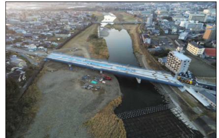
上部もほぼ出来上がりました。