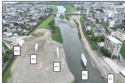
橋梁が完成しました。