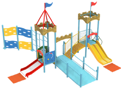
インクルーシブ遊具（障がいの有無に関係なく利用できる）