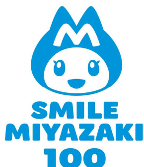
ロゴマーク (100周年記念バージョン)