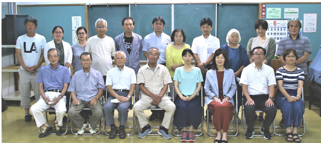
第8期東大宮地域自治区 地域協議会委員のみなさん