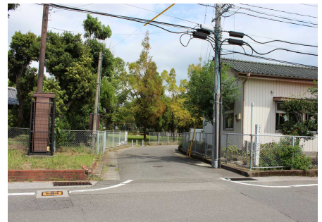
▲大島児童館と平原公園の間を通る市道

★市長からは、大島児童館については「平原公園を活用した形も含めて全体的に検討していきたい。」平原公園については「防犯も考慮し、災害時の避難場所としても活用できるよう皆様方と相談しながら改修していきたい。」また、コミュニティセンターについて「地域包括システムを見据えた施設とも書いてあり大事なことでもあるので、改修する部分についてはしっかりやっていこうと思っている。今後も協議をしその都度調整しながらより良い方向に行くよう考えているのでよろしくお願ひしたい。」との回答がありました。