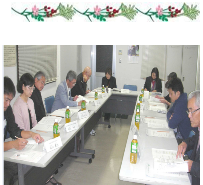
地域自治区地域協議会推薦委員会の様子

選考方法:東大宮地域自治区地域協議会推薦委員会で選考し、3月上旬に文書にて通知予定