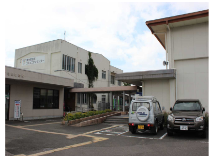
▲老朽化が進む東大宮地区 コミュニティセンター