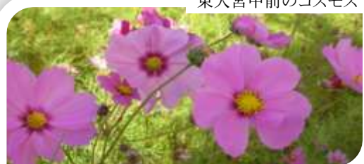
東大宮中前のコスモス