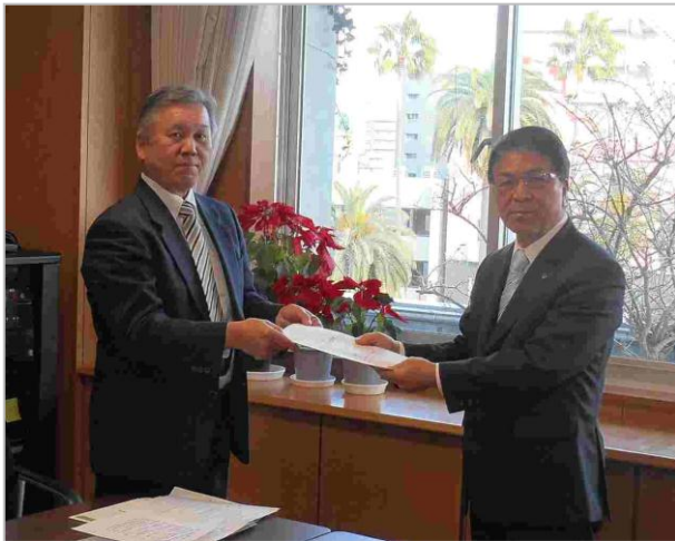
▲吉田会長が市長へ意見書を手渡しました。