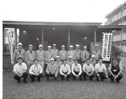
一の宮交番連絡協議会 防犯パトロール隊