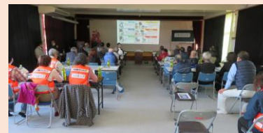
↓100均で揃う防災グッズ