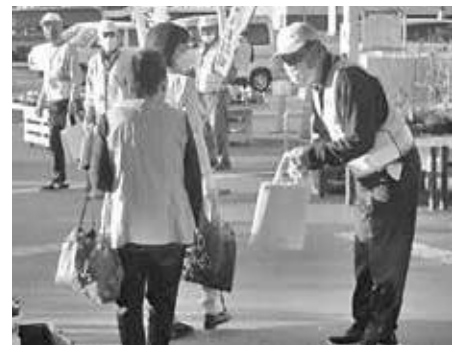
清武地域安全安心パトロール隊