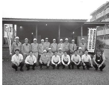
一の宮交番連絡協議会 防犯パトロール隊