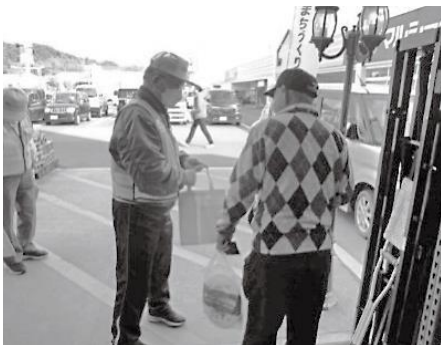
加納地域防犯パトロール隊