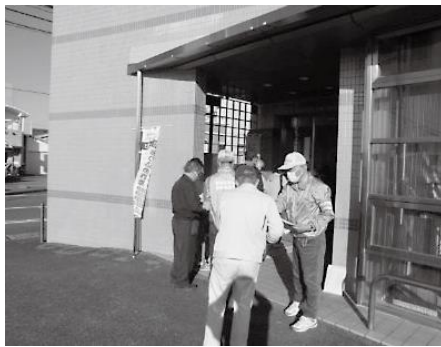
青葉町交番管内 地域安全推進協議会