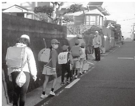
りんどうヶ丘子ども見守り会