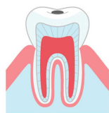
むし歯に なりかけの状態