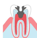
歯の神経まで 進行した状態