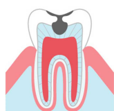
象牙質まで 進行した状態