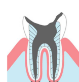
歯の根だけが 残った状態