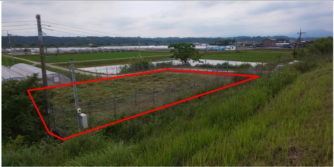
画像① 河川堤防上より撮影