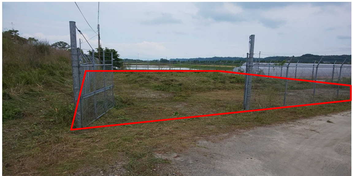
画像② 西側フェンス入口前より撮影