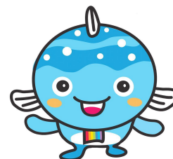
宮崎市河川浄化イメージキャラクター カワツツ