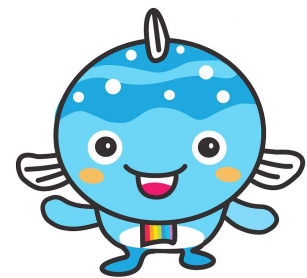
宮崎市河川浄化イメージキャラクター カワット