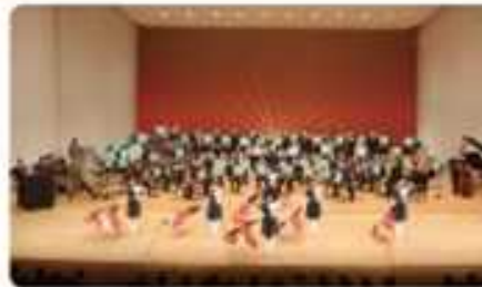
宮崎市消防団音楽隊