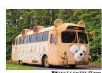
ダッフィーバス 展示場所 展示時間 10:00~16:00