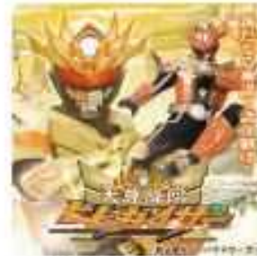
天尊降臨ヒムカイザー