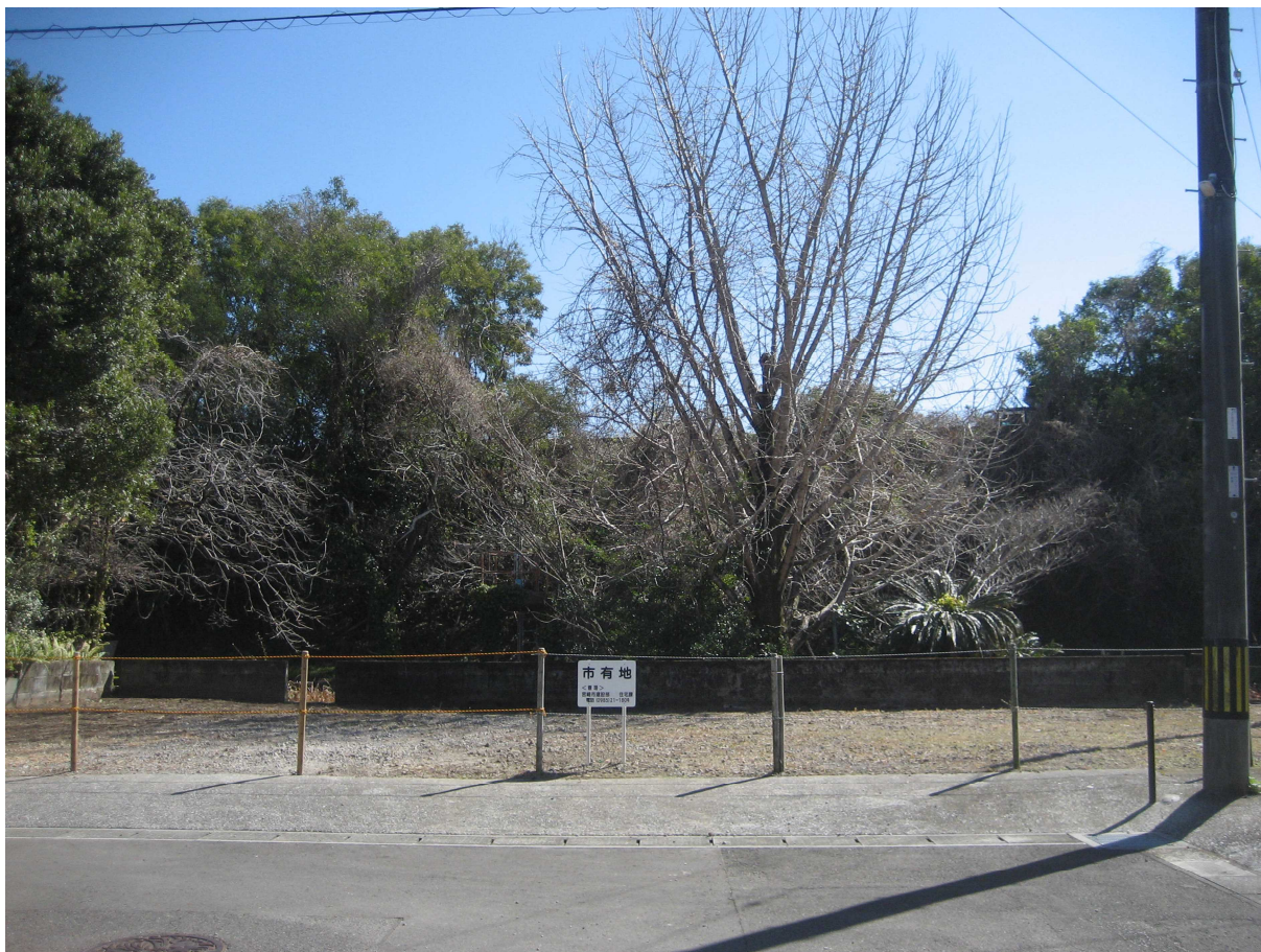
・北側から南側に向かって撮影