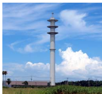
臨海部において、空に溶け込むような高明度の色彩で塗装された事例