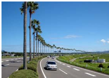
道路景観軸（国道 220 号）