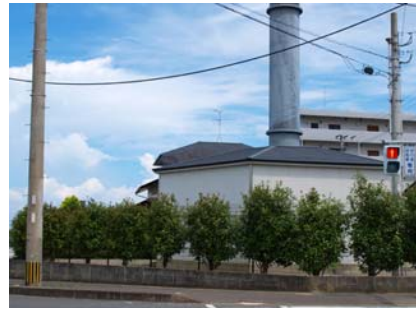
茶系のフェンスの外側に生垣で緑化された事例