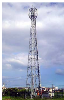
アングルトラス型