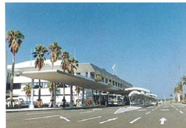
交通拠点（宮崎空港）