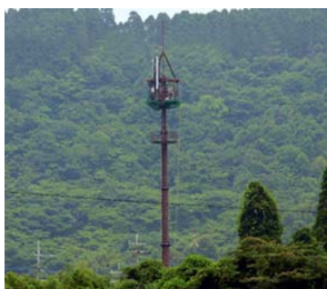
背景緑地との調和に配慮し、茶系で塗装された事例