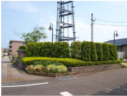
生垣、草花等で緑化し、鉄塔の基礎部分や設置機器を遮蔽した事例