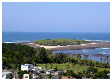
ランドマーク（青島）