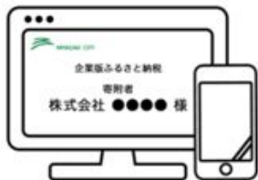
市HPに企業名及び 企業HPリンクの掲載