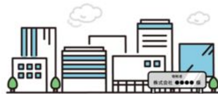
ネームプレートの設置 (100万円以上・ハード事業)