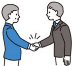
感謝状贈呈式 (300万円以上)