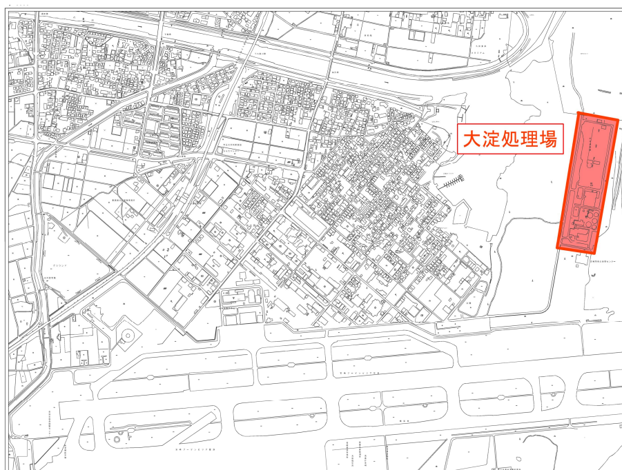
図 1 大淀処理場位置図