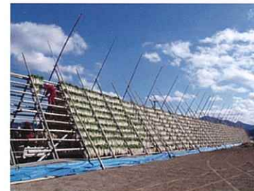
産業(田野町の大根やぐら)