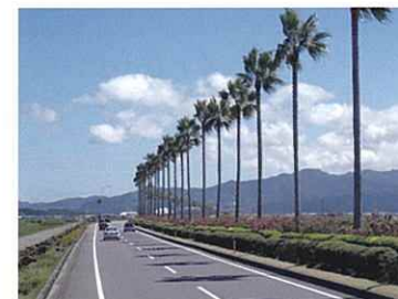
自然・道路(ヤシの並木道)