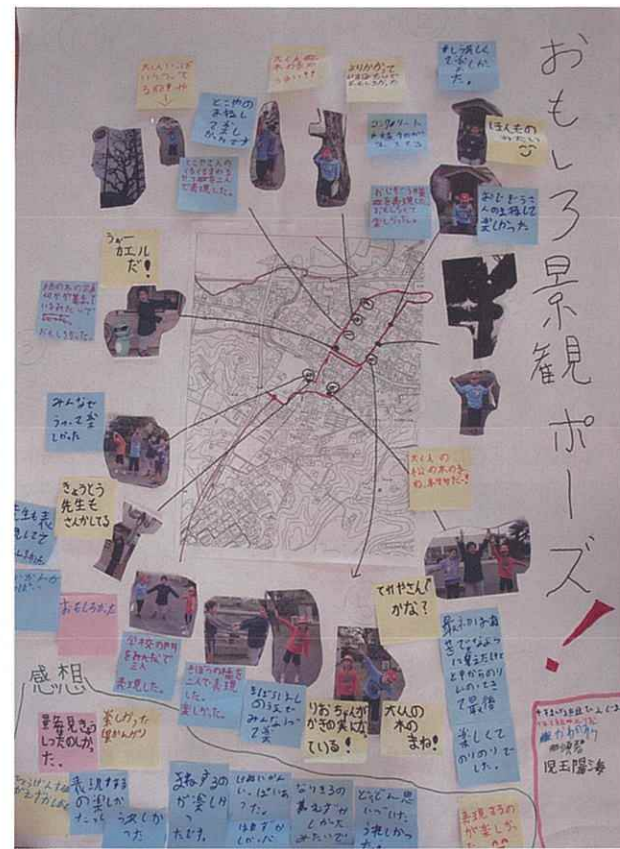
景観マップ「おもしろ景観ポーズ！」

★景観とは何かを学べたと共に、この授業を通して、みんな佐土原のことをもっと好きになってくれたようです。