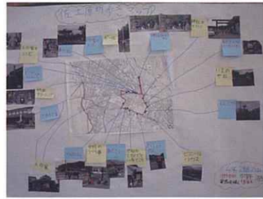
景観マップ「佐土原まち歩きマップ」