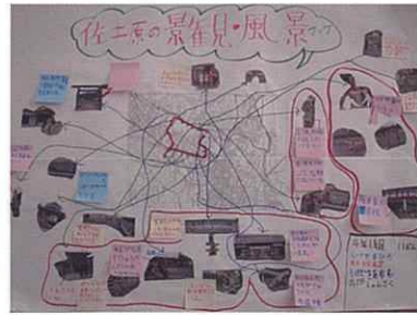
景観マップ「佐土原の景観風景マップ」