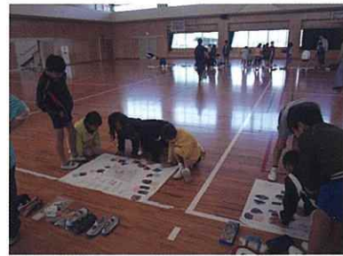
真剣に見ています

発表の後に、建築士会の皆さんが話し合った結果、「おもしろ景観ポーズ！」を作った班が優秀賞に輝きました。