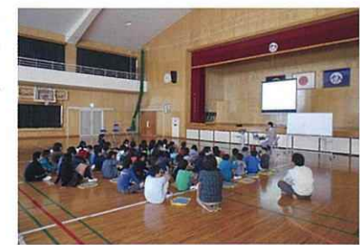
みんなしっかりと聞いています！