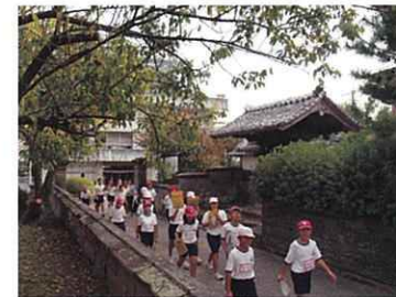
歴史(高岡町の石垣と武家門)