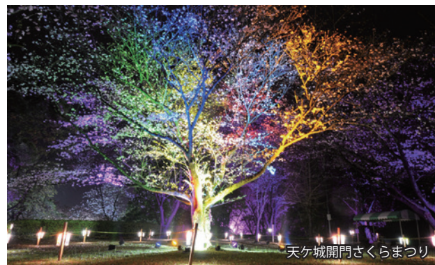
天ヶ城開門さくらまつり